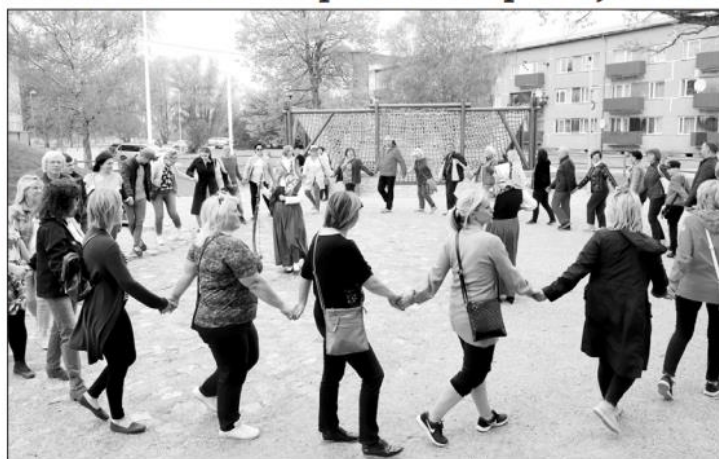
Tukuma novada domes pārstāvji atzinīgi novērtēja lībiešu zvejnieku sētu Tārgalē.